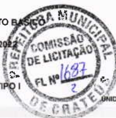
Tabela: 027.1 - SEINFRA - CE DESONERADA / SINAPI REF 01/2022