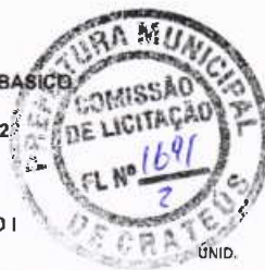
Tabela: 027.1 - SEINFRA - CE DESONERADA / SINAPI REF 01/2022