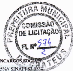
TABELA DE ENCARGOS