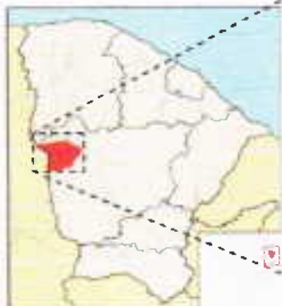
Localização do Município