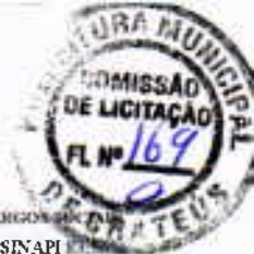
TABELA DE ENCARGOS