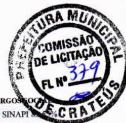
TABELA DE ENCARGOS