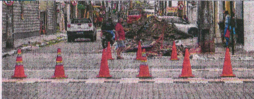
UM NOVO bloqueio foi instalado para início da terceira e última etapa das obras de urbanização da rua 24 de maio

A via que vai dar acesso ao terminal aberto pretende auxiliar no deslocamento de usuários do transporte público entre a Praça da Estação e Terminal José de Alencar. A obra está orçada em