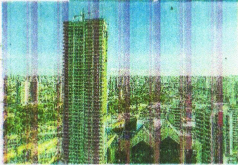
CONSTRUÇÃO de arranha-céu na orla de Fortaleza